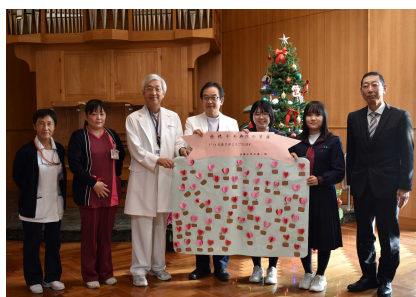
赤穂中央病院 での贈呈式

福祉・ボランティア部を中心に、医療従事者の方々に笑顔になってもらえるよう感謝のメッセージカードを作成しました。12月16日（金）に赤穂中央病院、赤穂市民病院へメッセージカードを貼った模造紙を届けてきました。