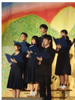
生徒会セレモニー