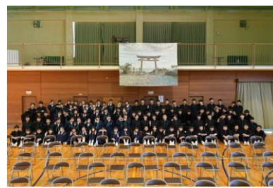
1 年生学年作品展示