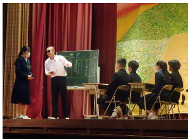
2 年生トライやる・ウィーク発表

合唱コンクールや文化祭といった行事がようやく東中に戻ってきました。1つの目標に向かって、一人一人が自分の力を持ち寄って、合わせる。少しの勇気が、想像以上の大きな力になる。それを観ることが観る者にも感動をもたらす。体験による感動は生きる力を与えてくれるものです。