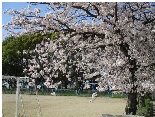
<運動場の桜(4月10日朝)>

6年生は、「歓迎の言葉」と「校歌」で入学をお祝いし、1年生は、「ドキドキドン! 一年生」を元気に歌うことができました。最後まで、しっかりとお話を聞くことができた1年生、立派でした。