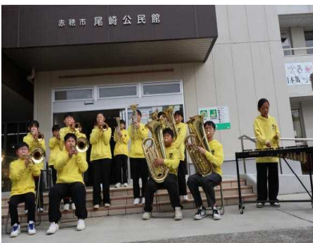
○ふるさとまつり（鎗バンドクラブ）