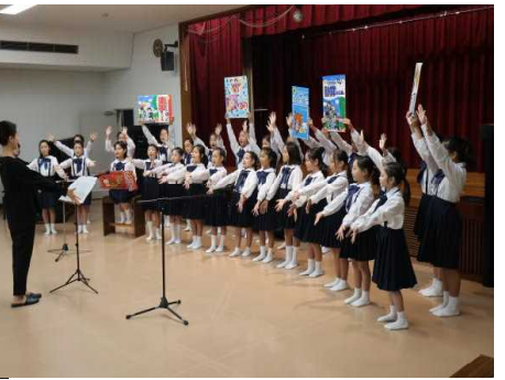
○ふるさとまつり（コーラス部）