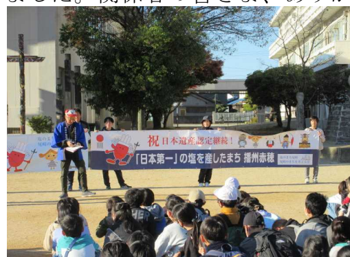
○尾崎を学ぶデー（尾崎ウォークラリー）

ご家族や地域の皆さま、引き続き子供たちを温かく見守ってくださいますようお願い申し上げます。来たる年が穏やかで幸多い年でありますよう心から願っております。