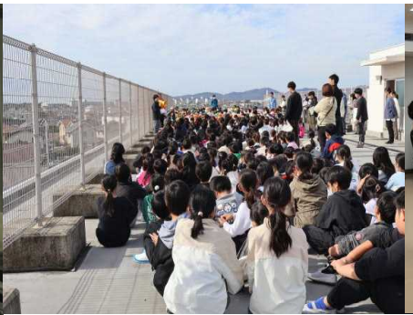
○保幼小合同避難訓練