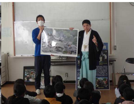
○尾崎を学ぶデー（ゲストティーチャー）