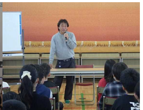
○尾崎を学ぶデー（ゲストティーチャー）