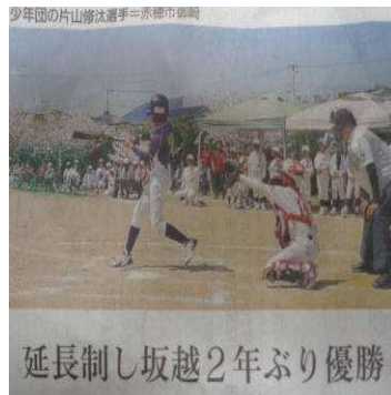
延長制し坂越2年ぶり優勝

県ジュニアあかふじ米軟式野球大会 西播 B 地区（赤穂市）で優勝し、8月3日に行われる県大会に出場することが決定しました。決勝は延長戦タイブレークの末、見事にサヨナラ勝ちとなり、昨年の悔しさも合わせて、倍増の喜びでした。県大会もがんばって下さい。