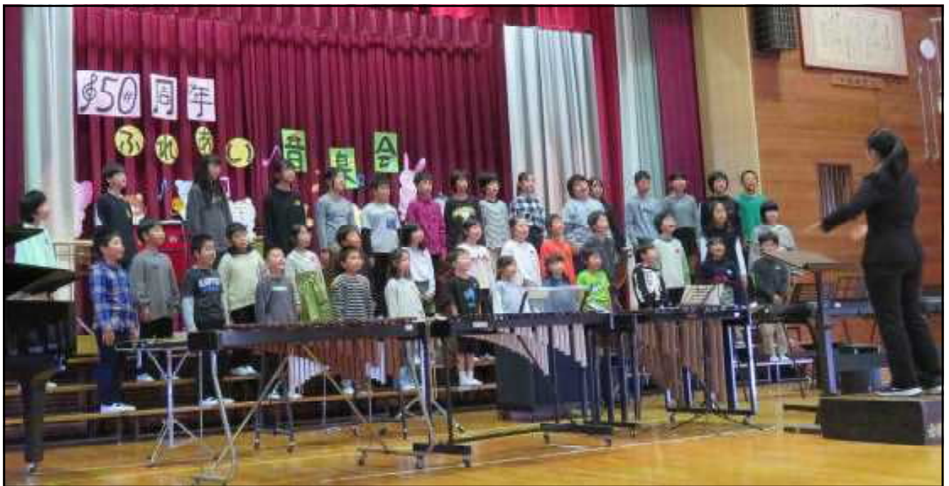
↑ 全校での「愛する街赤穂」 有年っ子のハーモニーが響き渡りました！

6年生は一人一役で仕事を担い、進行や挨拶を堂々とやり遂げることができました。どの学年も、台詞や150周年お祝いメッセージ、会場とかけ声のコラボなど、工夫を凝らした演出があり、練習の成果と有年っ子の元気を披露することができたと思います。最後までお聴きいただき、あたたかな拍手をいただきましたこと、お礼申し上げます。