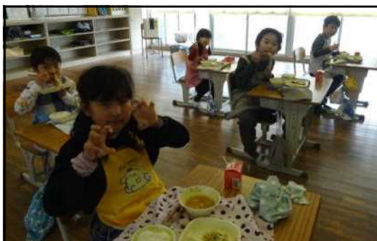
←【おいしい給食】 2年生は毎日もりもり食べています。