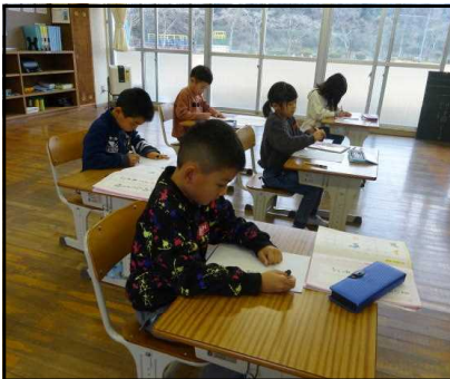
↑【よい姿勢で書き初め】 1年生がペンで書き初め中！