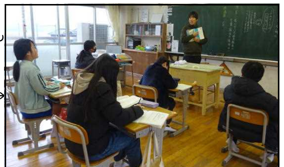
【活気ある学習】→ 互いの意見で学び合う5年生。