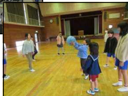
体育館で→ 「上手に とれたよ」