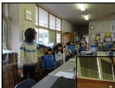
←学校探検 「いろんな 部屋があるね」