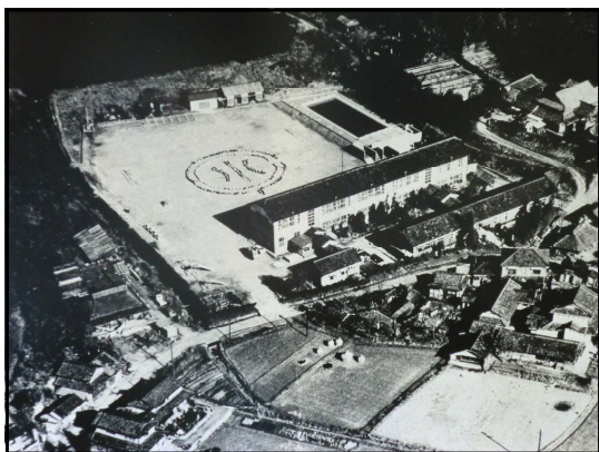
↑今の「千種の苑」の場所にあった旧校舎

校訓「ほがらか はつらつ すこやか」のもと、有年っ子達とともにこれからも歴史と伝統をつないでいきたいです。