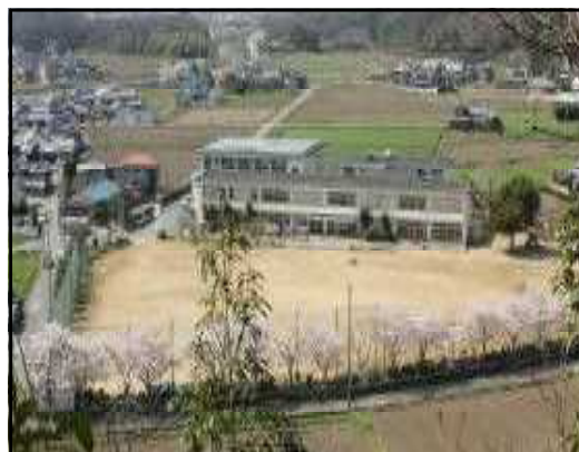
↑豊かな自然に囲まれた有年小学校