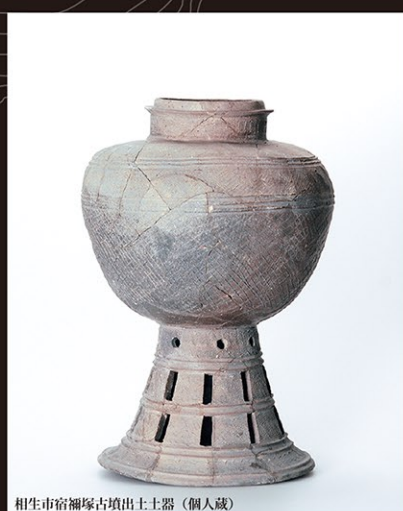
相生市宿禰塚古墳出土土器 (個人蔵)