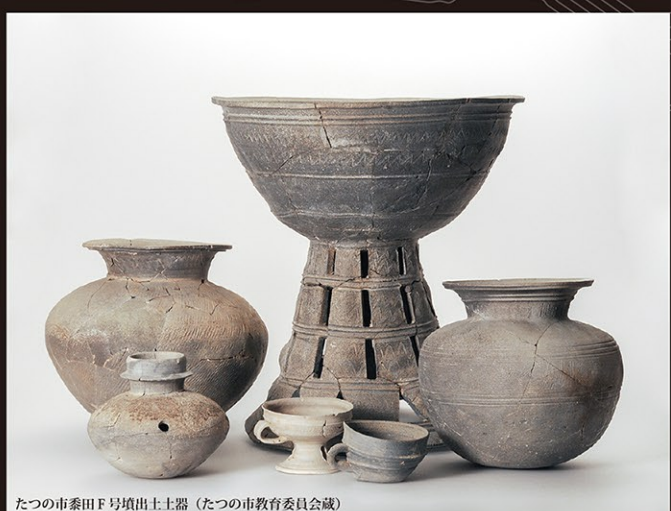
たつの市田代F号墳出土土器 (たつの市教育委員会蔵)

主催 赤穂市立有年考古館・神戸新聞社 後援 サンテレビジョン・ラジオ関西・NHK神戸放送局姫路支局