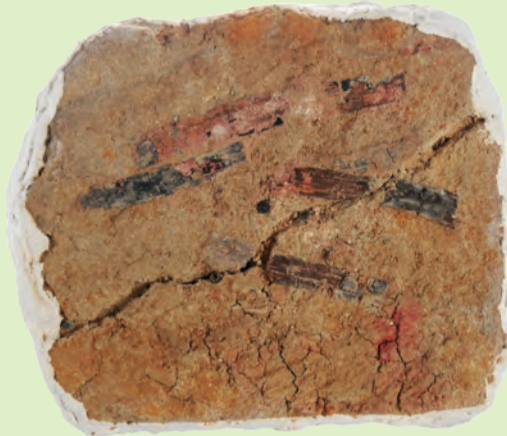
西野山3号墳 剥ぎ取り資料