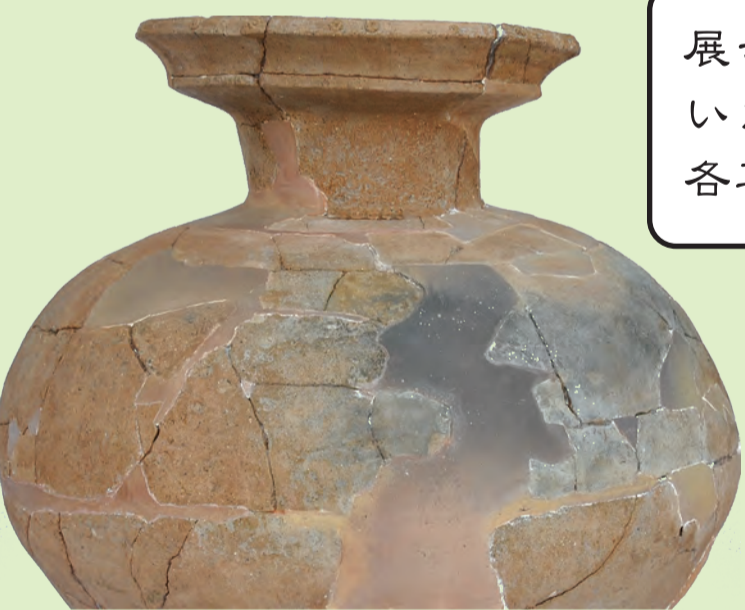
有年牟礼・山田遺跡出土遺物 レプリカ製作