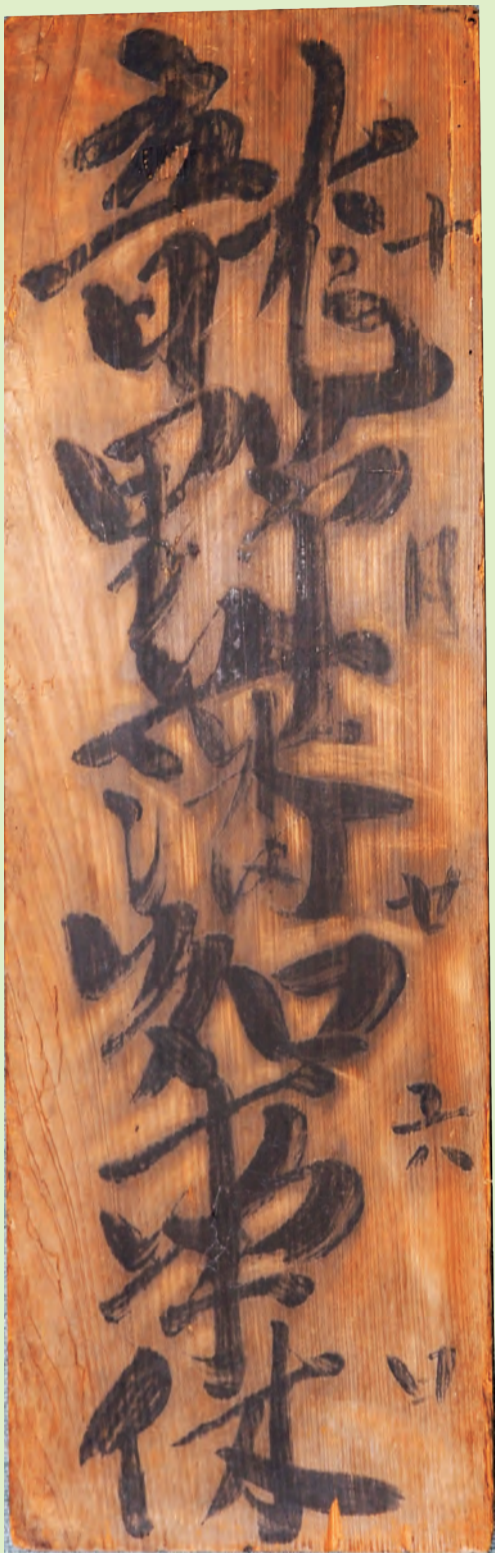
「龍野藩知事休」宿札