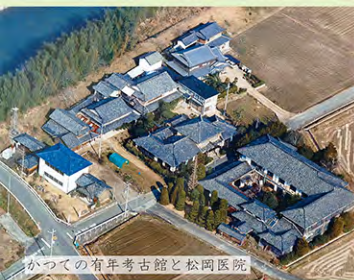
かつての有年考古館と松岡医院