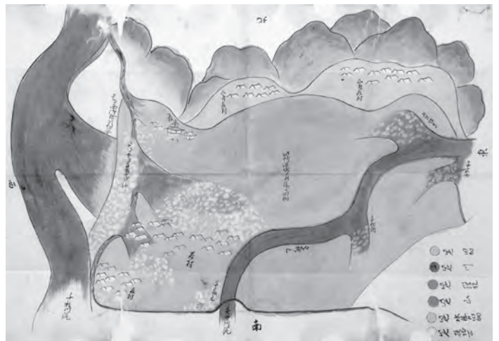
「原村洪水絵図」 有年原自治会所有