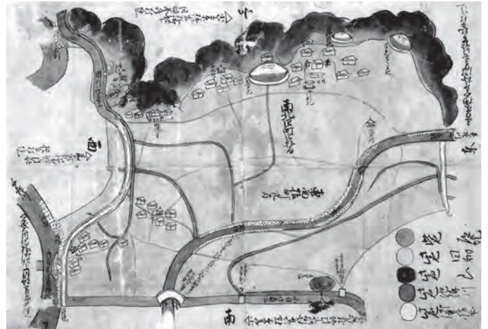
「原村御普請所絵図」(文化年間) 有年原自治会所有

「村絵図」は、江戸時代に村の会所（現在でいうところの役所・役場や自治会）が作成したもので、山林や田畑の所有者、河川の堤防や農業用水路の工事、水利権や山林の所有権の話し合いなどを目的として作られました。