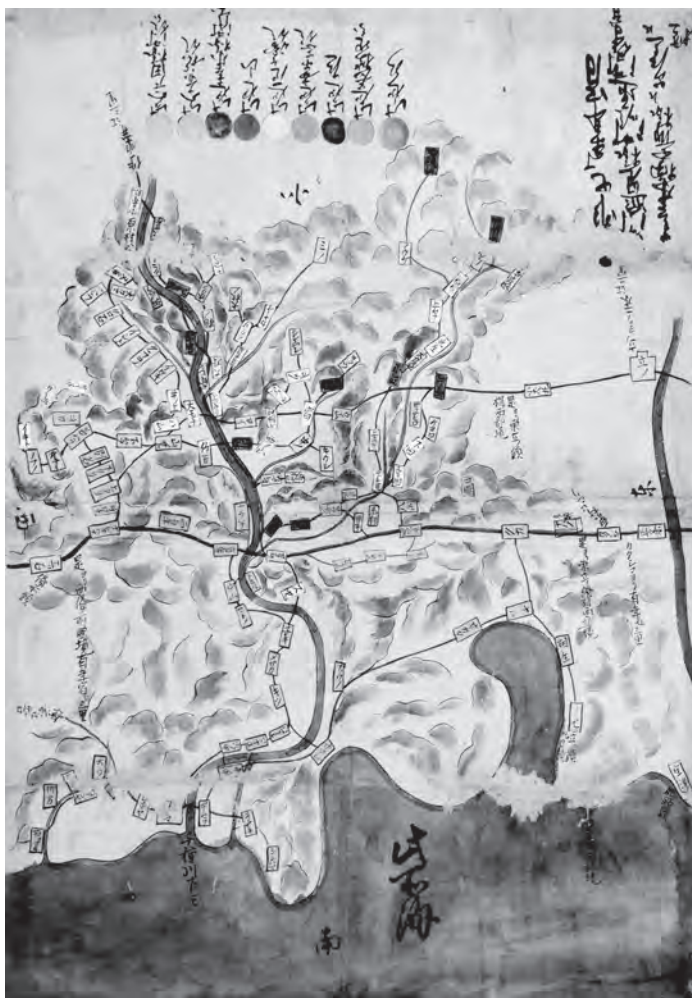
「赤穂郡絵図」(天明7・1787年) 有年原自治会所有

これらの「村絵図」には、当時の村々の様子が詳細に描き出されており、現在は失われた江戸時代の村の風景を知ることができます。