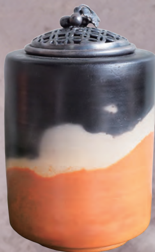
赤穂 赤穂雲火焼・香炉 (桃井ミュージアム蔵)

主催：赤穂市立有年考古館・神戸新聞社 後援：サンテレビジョン・ラジオ関西・NHK 神戸放送局