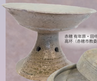
赤穂 有年原・田中遺跡 高坏 (赤穂市教委蔵)