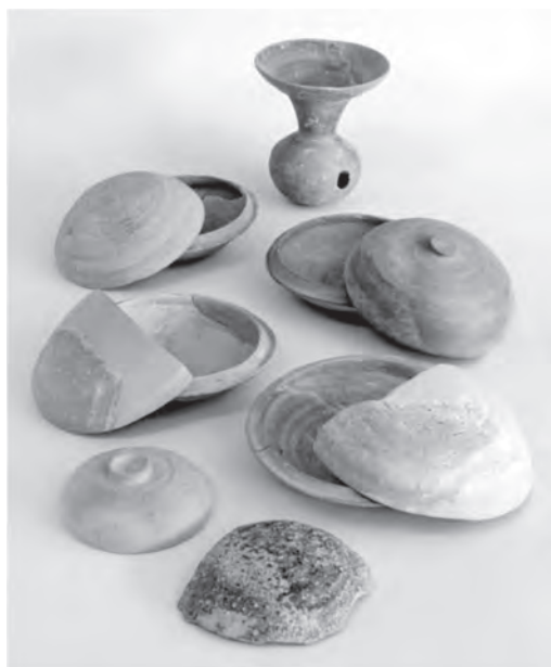
尾崎大塚古墳出土 須恵器

今回の企画展では、これまで発掘調査の行われた赤穂市内の墓や古墳について紹介し、そこからどのような歴史がわかるのかについて解説します。