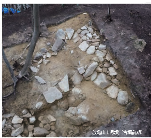
放亀山1号墳 (古墳前期)