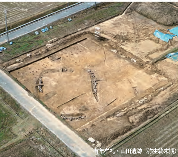
有年牟礼・山田遺跡 (弥生終末期)