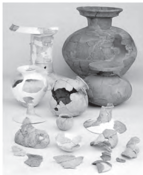
有年牟礼・山田1号方形周溝墓出土 土器