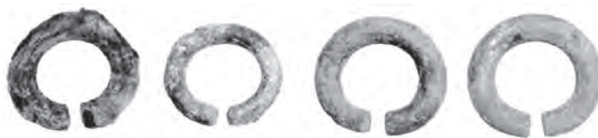
木虎谷11号墳出土 耳環