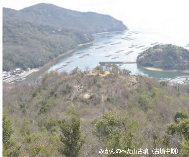
みかんのへた山古墳 (古墳中期)