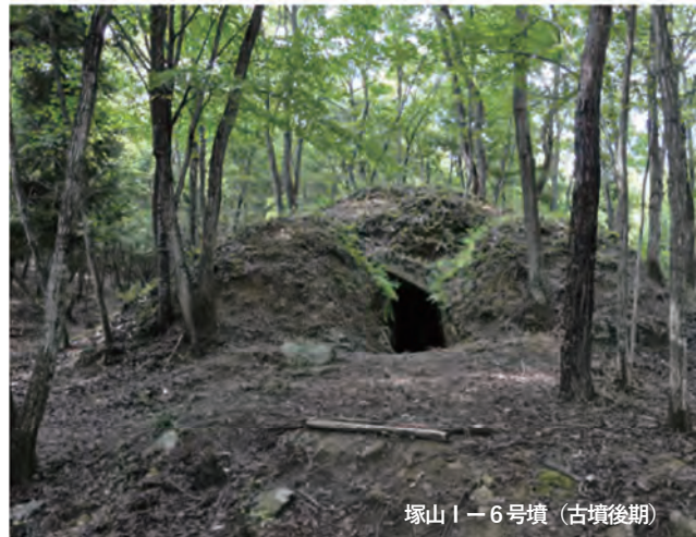
塚山1-6号墳 (古墳後期)