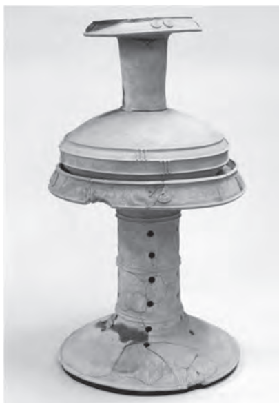
有年原・田中1号墳丘墓出土 土器

赤穂市でも、多くの墓や古墳が調査されており、当時の社会のようすがあきらかになってきています。