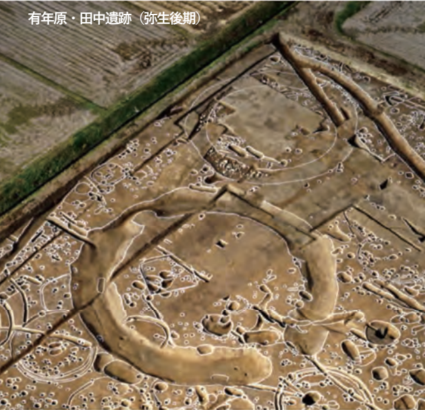
有年原・田中遺跡 (弥生後期)