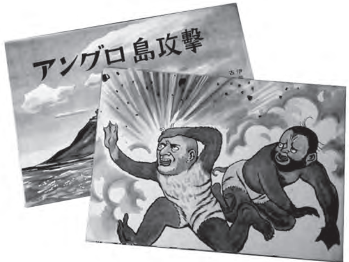
戦意高揚のために上演された紙芝居

終戦から70年以上がたち、時代も昭和から平成へ、そして平成時代も終わろうとしています。