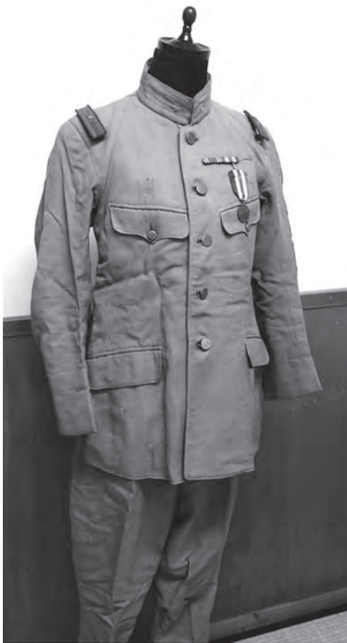
旧日本陸軍軍服 (旧有年村在郷軍人会長着用)