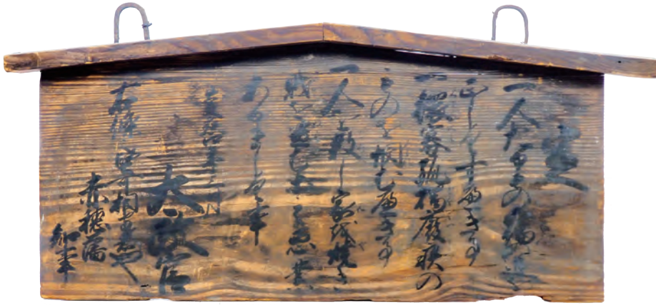
五榜の掲示第一札「人たるもの」(幕末～明治時代初頭)