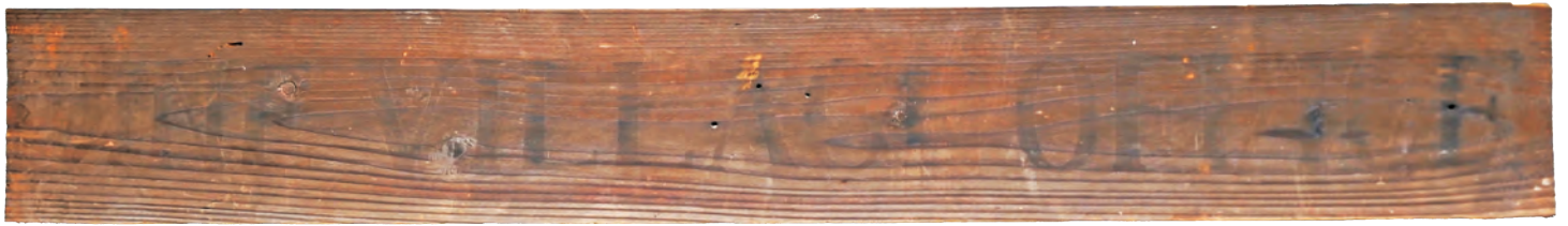
旧有年村役場看板「FUNE VILLAGE OFFICE」(近代)