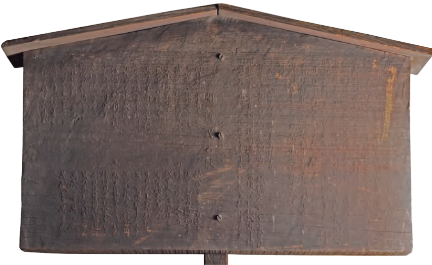
旧有年橋標柱 顕彰立札(昭和時代)