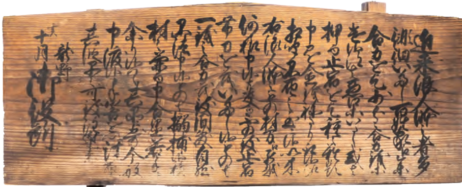
浪人取締高札(江戸時代)