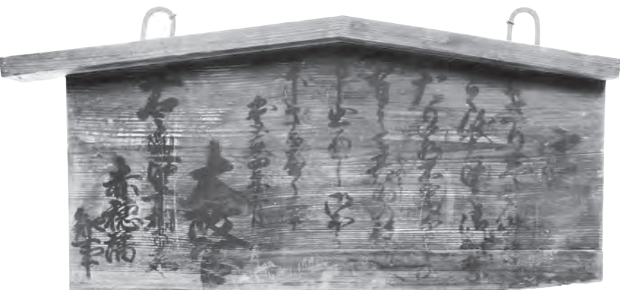
五榜の掲示第三札「きりたん」制札（幕末～明治時代初頭・赤穂藩知事）

今回の展示では、当館の収蔵品の中から、看板や立札に焦点をあて、その内容と特徴的な歴史についてご紹介いたします。