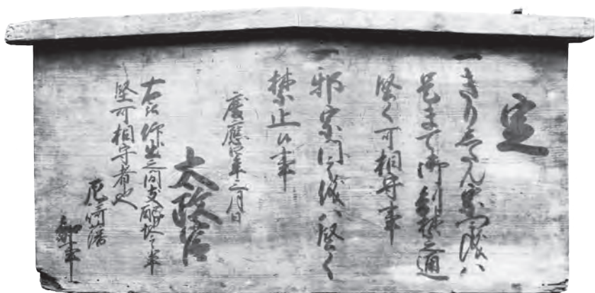
五榜の掲示第三札「きりたん」制札（幕末～明治時代初頭・尼崎藩知事）