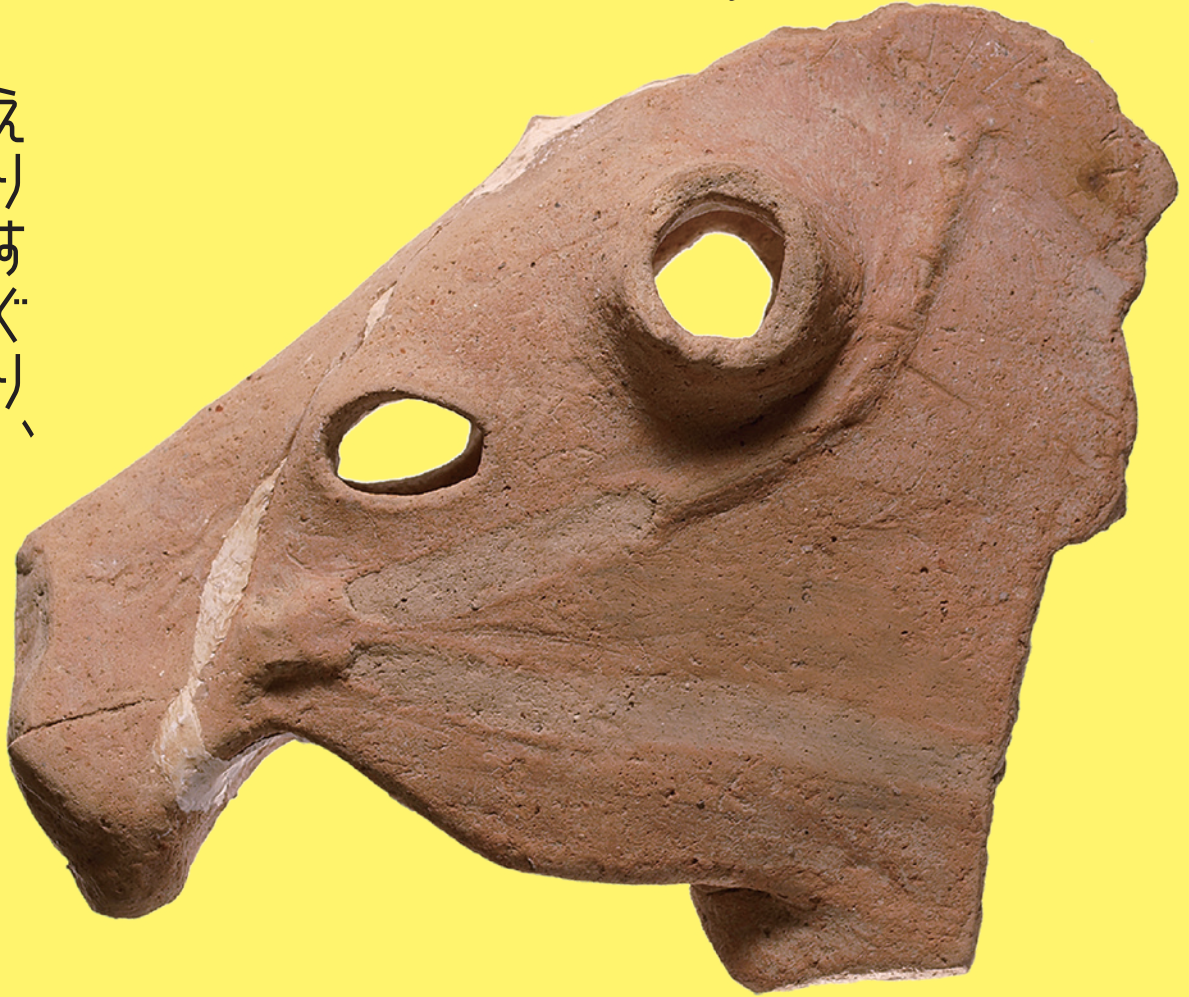
蛭無山1号墳出土 馬形埴輪 (当館蔵)