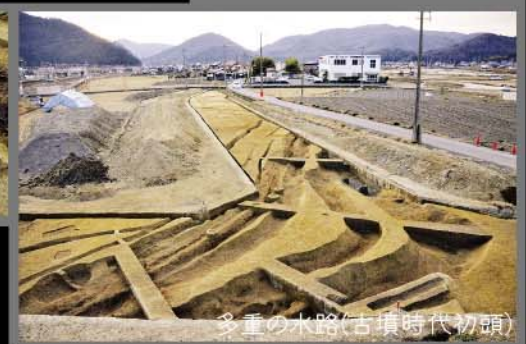
多重の水路(古墳時代初頭)