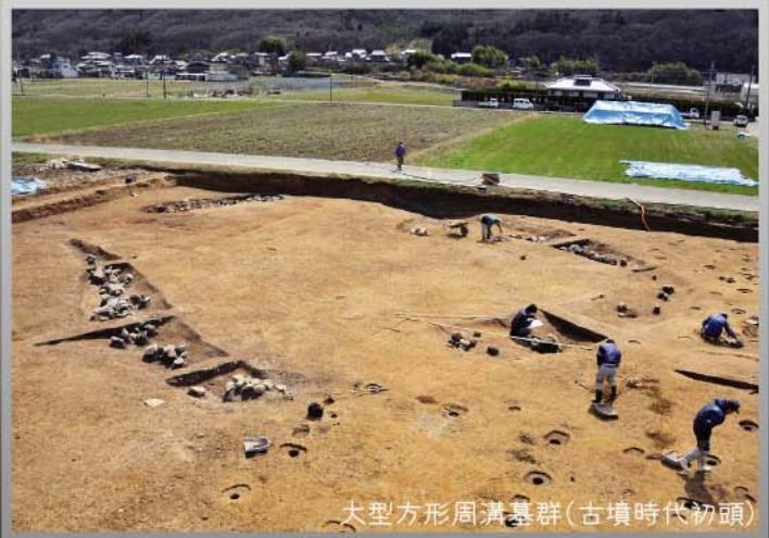
大型方形周溝墓群(古墳時代初頭)