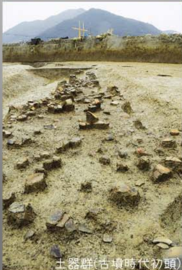
土器群(古墳時代初頭)