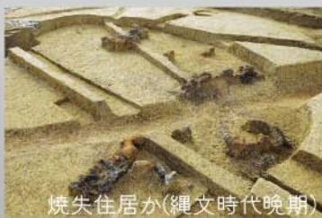
焼失住居か(縄文時代晩期)