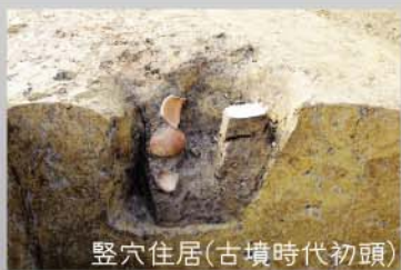
竪穴住居(古墳時代初頭)