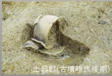
土器群(古墳時代後期)