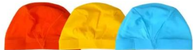
↑オレンジ↑ ↑イエロー↑ ↑サックス↑