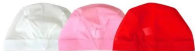
↑ホワイト↑ ↑ピンク↑ ↑レッド↑