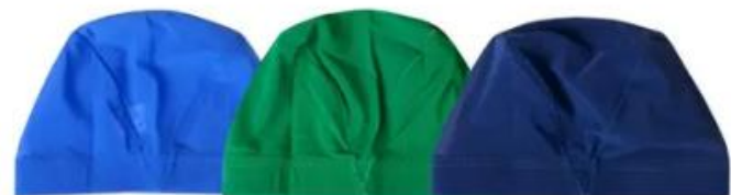
↑ブルー↑ ↑グリーン↑ ↑ネイビー↑