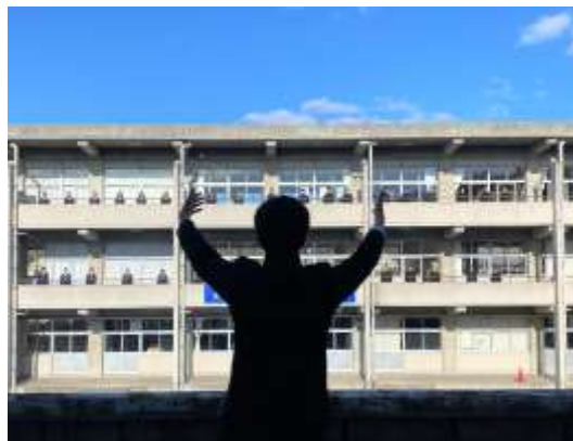
文化祭ウィーク 中庭を使つての合唱の様子（3年）

その成果が、それぞれの部活動での活躍、マーチングフェスティバル、海岸清掃、修学旅行、