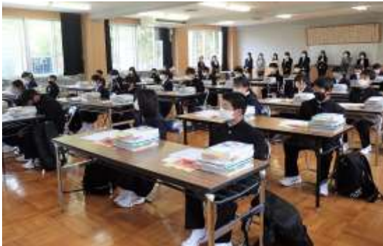
(多目的室での学級開きの様子) (新入生)

学校再開後は、心配していた新たな感染者も無く、生徒達が元気に新しい環境で生活している姿を見て、「本当によかったなあ」と心から思いました。