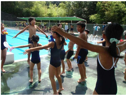
地区ごとに準備体操をします

いよいよ今週末から夏休みに入ります。そして、子どもたちが楽しみにしている地区水泳も始まります。