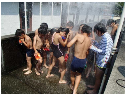
準備体操が終わったらシャワーです

地区水泳は7月21日から8月4日までの9日間です。この間保護者皆さまには監視等でお世話になりますが、事故のない楽しい地区水泳となりますようご協力をよろしくお願いいたします。