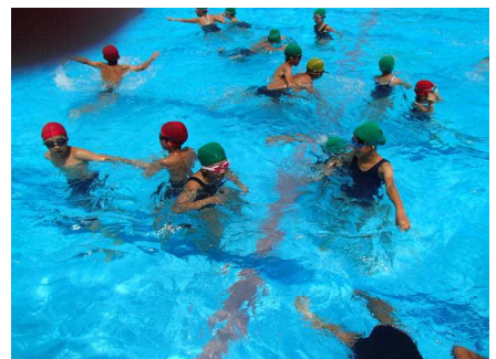
楽しく泳いでいます！！