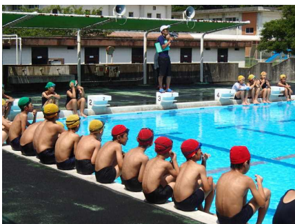
プールサイドに地区ごとに整列です