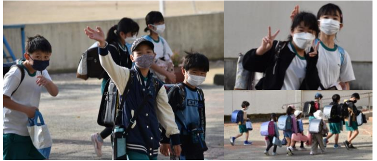
城西っ子はガッツよりピース 今日も元気に登校待ってたよ!