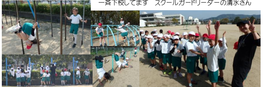
2年生 体育 ぶら下がり大好き ← 城西っ子の体力課題「握力」強化中!