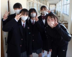
卒業生は城西っ子永久会員です