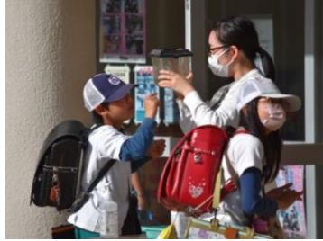
みんなに見せたい大発見を持参