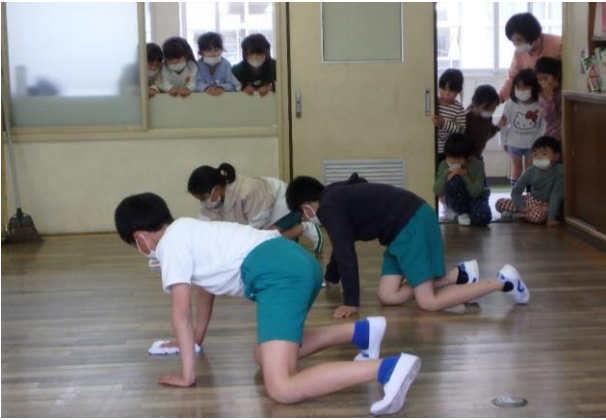
1年生教室を掃除する6年生を見て学ぶ1年生