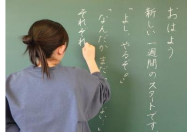
先生の気合いの源は、愛情♡