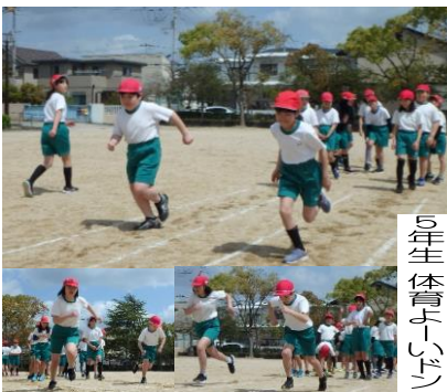
5年生 体育 よんじん