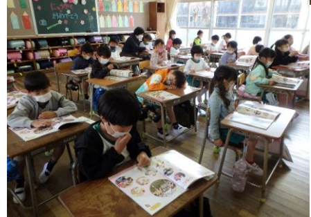
1年生 さあ！小学生の学習が始まったよ