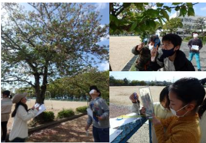
4年生 理科 さくらの観察