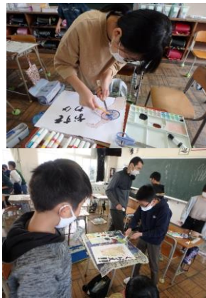
6年生 図工 表現の工夫