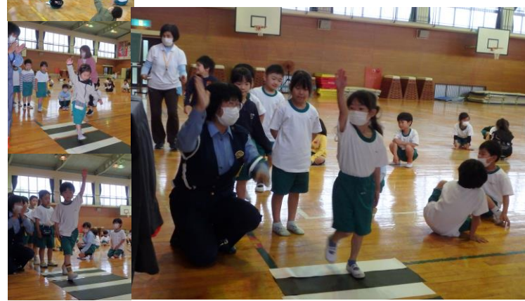
1年生 交通安全教室 横断歩道のわたり方を確認しました