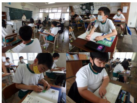
6年生 算数 分数×分数を考える