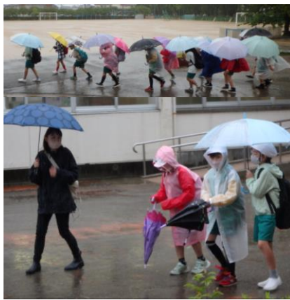
4年生 社会科 美化センター見学に出発