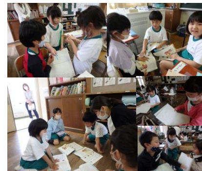
1年生 国語 学び合う場面