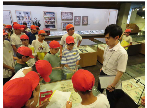
【歴史博物館で学習中】