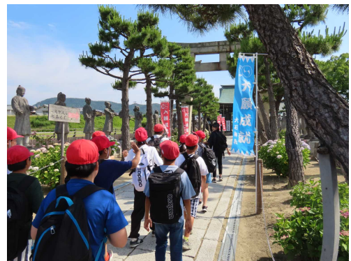
【大石神社に入る6年生】

知れば知るほど、疑問が生まれてくる「打ち入りにまつわるお話」です。学習がさらに深まるといいですね。