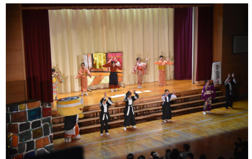
〈大石祇園通いの場 より〉

さて、当日は、10の場面が演じられました、「子ども義士物語」は、テレビや映画でも有名な「刃傷松の廊下場」や「討ち入りの場」、少しユーモアが入った「大石祇園通いの場」等、赤穂義士の思いを伝える有名な場面で構成されています。