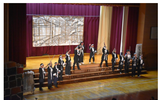
〈討ち入りの場 より〉

城西小学校区内には、「赤穂城」「大石神社」「義士邸宅」など、赤穂義士とつながる場がたくさんあります。赤穂義士に関する学びの総決算として、「子ども義士物語」を演じるのですが、何より「演じること」が大きな学びであるように感じます。「舞台の上で大きな声を出すこと」や「義士の心を込めて演じる」ことも意義深いものです。6年生の児童の皆さんは、大きな声と大きな動きで、立派に物語を演じることができました。30年も続いている「義士物語」のバトンを見事につなぐことができました。