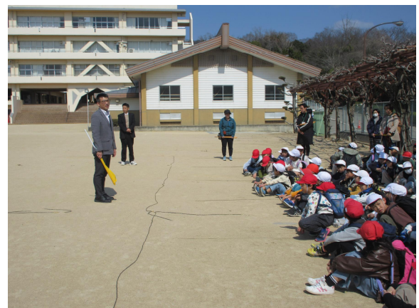
【赤穂中学校教頭先生のお話】

「高い所」「命の大切さ」という意識がさらに高揚した貴重な学習となりました。お世話になった皆様、本当にありがとうございました。