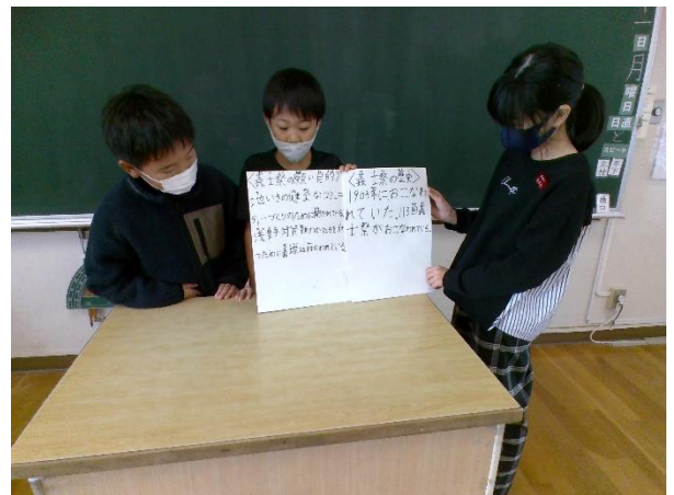
4年生の義士学習の様子

義士祭に至るまでの赤穂義士の歴史や義士祭を行う目的について調べ、絵本を作成してまとめました。