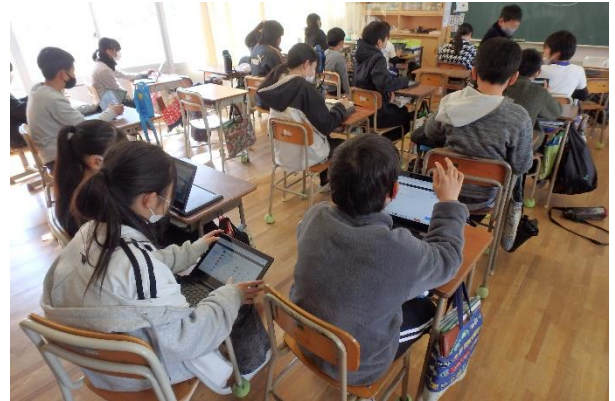
6年生が義士クイズに取り組んでいる様子

タブレット端末を用いて、義士クイズの練習に進んでチャレンジしました。間違えた箇所を振り返り、全問正解に向けて意欲的に取り組んでいました。