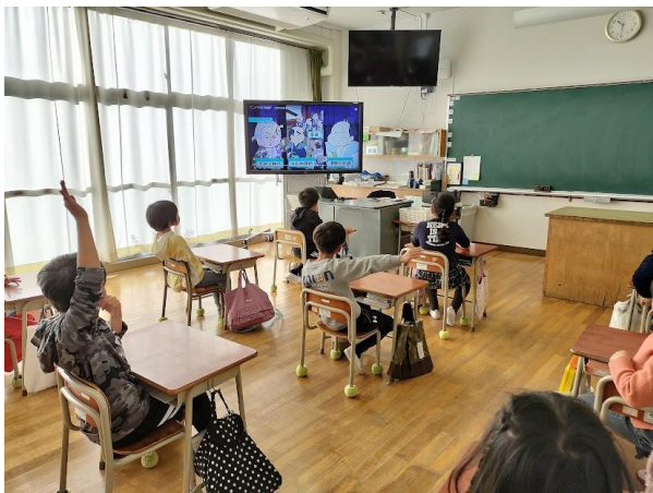
2年生の義士学習の様子

インターネットで「2分で分かる忠臣蔵」という動画を見て1年生で学習した内容を思い出しました。その後、赤穂義士絵物語の範読を聞きながら、簡単な人物相関図を見て内容を再確認しました。