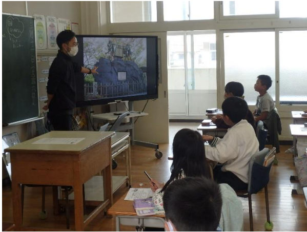
4年生の義士学習の様子

赤穂義士資料を使って学習しました。身近な写真から興味を持って赤穂義士についての学習に望みました。