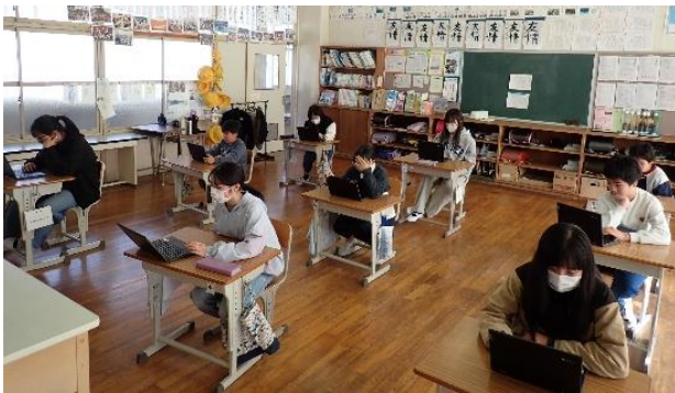
6年生の義士学習の様子

赤穂義士物語や義士にまつわる絵本を読んだり、赤穂市教育研究所HPの義士クイズを解いたりしながら、赤穂義士の歴史や人物の関係を学びました。そして、自作のクイズを作り、みんなで交流することで学びを深めました。