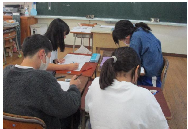
5年生の義士学習の様子

赤穂事件について学習し、義士たちの生き方について考え、意見交流を行いました。今と昔の時代背景の違いを踏まえつつ、「生きる意味」について考えることができました。