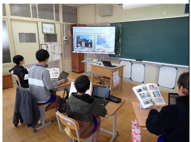
6年生がタブレット端末で 義士学習に取り組む様子

赤穂市教育研究所HPにある義士クイズに挑戦し、赤穂ならではの歴史について理解を深めました。義士に関する学習を行うことで郷土に対する愛着を深めることができました。