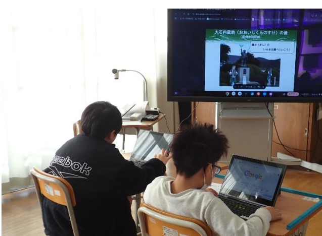
3年生の義士学習の様子

赤穂義士のお話に興味をもち、赤穂義士に関係のある遺跡について調べました。たくさんの遺跡があることを知り、折を見て巡ってみたいという思いを持つことができました。