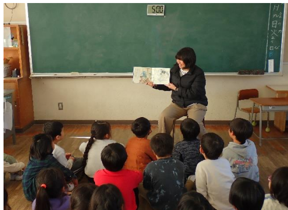
1年生の義士学習の様子

初めて学習する赤穂義士。先生の読み聞かせにより、少しずつ赤穂義士について知ることができました。また、絵本を通して今の時代と比べながら昔のことを学ぶことができました。