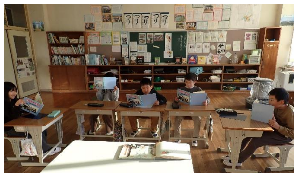
3年生の義士学習の様子

パワーポイントや絵本を使って、赤穂の歴史や義士にまつわる史跡について学習しました。市内にはたくさんの歴史あるものが残っていることに驚きました。