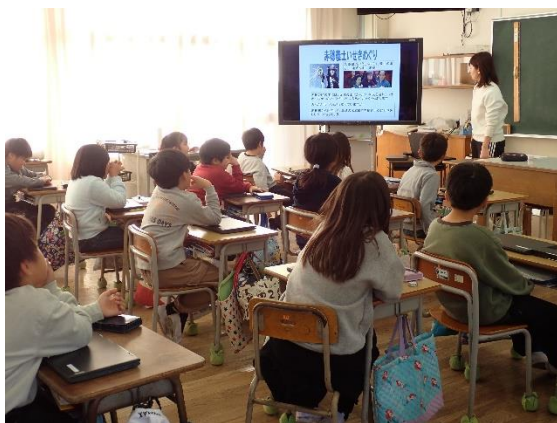
3年生の義士学習の様子

スライドを使い、赤穂義士の史跡や遺跡について学習しました。自分たちの身近にたくさんの史跡や遺跡があることを知り、赤穂の歴史や町への興味関心を高めることができました。