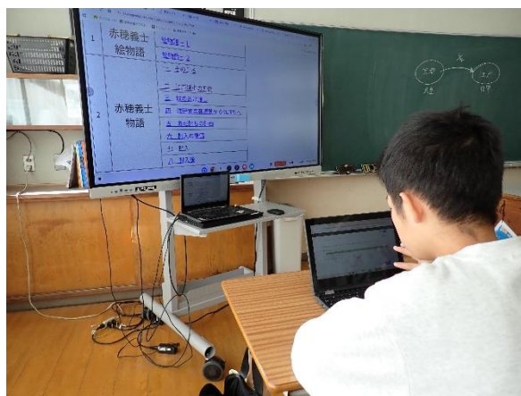
6年生が義士クイズに挑戦している様子

義士教育を通して獲得した知識を使って、義士クイズに挑戦しました。何度も挑戦したり、友達と教えあったりして知識を深めることができました。