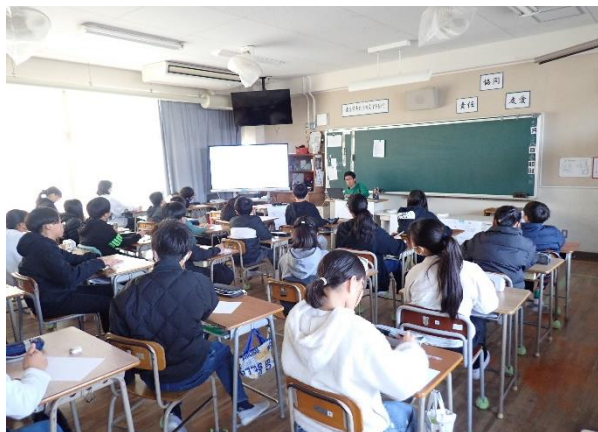
6年生の義士学習の様子

義士検定全員合格を目指してクラス全員で義士について学びました。ただ問題を解くだけでなく、自分だったらどうするかなど深いところまで考えることができました。