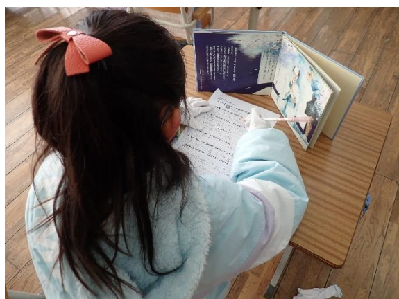
4年生の義士学習の様子

義士の本やパワーポイントを使って義士学習に取り組みました。どんな事件だったのかについて調べたことから、義士の思いについて考えることができました。