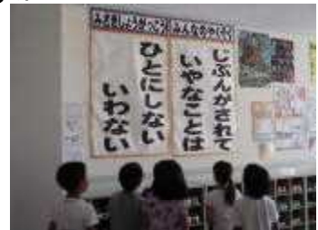
〈掲示に見入る1年生〉

1学期にも全校朝会で話をし、子どもたちと約束したことです。学校生活など集団で生活していく上で、最もシンプルで大切な約束事といわれれば、「自分がされていやなことは、人にしない。言わない。」だと思います。機会あるごとに子どもたちに話しているのですが、今回もしばらくの間、校内に掲示し、意識付けを図りながら全校で取り組んでいきます。