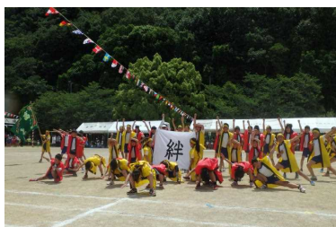
3・4年表現(ソーラン)