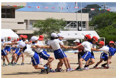
3・4年競争遊戯(棒引き)