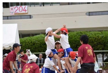
5・6年競争遊戯(騎馬戦)