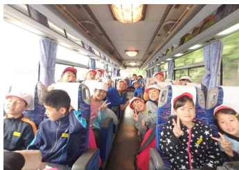
さあこれから出発だ