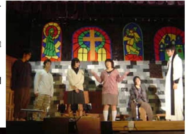
< 3年2組 緑の星の下に >