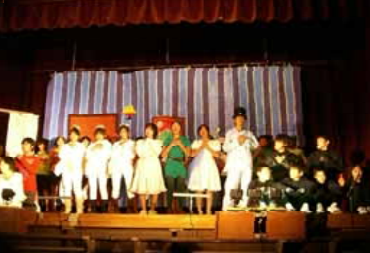
< 1年 ピーターパン2 >

1年から3年までみんなが協力できていて、全校生とが胸を張ってやっていたと思います。1年は初めてなのにきちんとできていたし、2年はだいぶテキパキできていたし、3年はやっぱりすばらしかったです。すごいです。来年、私達もそう思われるように考えて頑張れたらいいと思います。