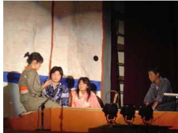
< 3年1組 ベロ出しチョンマ >

今年もたくさんの保護者の皆様、地域の皆様にご協力いただき、多くの収益を上げることができました。この中から、文化祭の物品購入費を差し引きし、残金を生徒会特別会計に入れさせていただきます。今後の生徒会活動に有効に活用させていただきます。ありがとうございました。