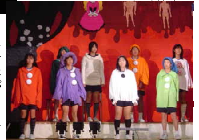
< 2年2組 人形館 >