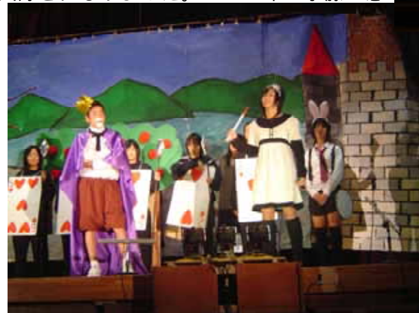
< 2年1組 不思議の国の・・・ >