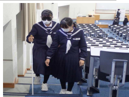
ガイドヘルプ体験

関西福祉大学にて、ガイドヘルプ体験と車椅子サポート体験を実施しました。福祉について深く学ぶことができました。