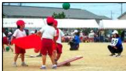
スカッとキャッチ!!