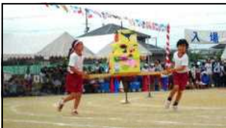
落とさず運べ! 宅急便!!