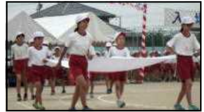
堂々とした入場行進

令和元年6月2日。強い日差しもなく爽やかな天候のもと運動会を開催しました。この日まで友だちと励まし合いながら、何回も繰り返した練習。その成果がしっかりと発揮されました。また、子どもたちは、どの演技にも力を出し切ろう！最後までがんばろうとする態度が見られました。とても素晴らしかったです。