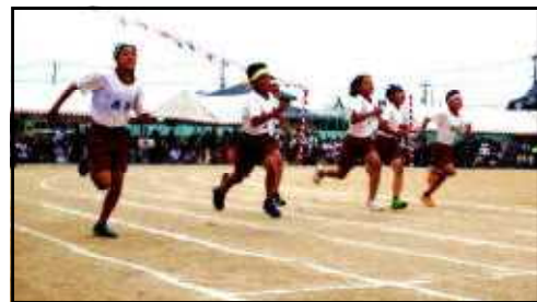
最後の最後まで全力で走る!