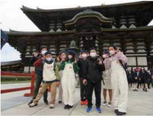
【東大寺 大仏殿の前で】

10月27日(木)・28日(金)、6年生は、奈良・京都へ修学旅行に出かけました。晴天に恵まれ、交通渋滞に巻き込まれることもなく、スムーズに行程を進めることができました。古都の歴史に触れ、仲間とともに過ごす時間を楽しみ、最高の思い出ができた2日間でした。8人が揃って、元気に出発し、元気に帰ってこられたのが何よりうれしかったです!!