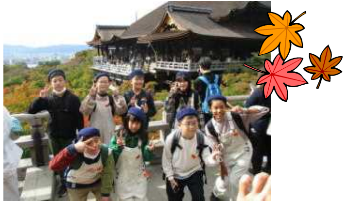
【清水の舞台をバックに】