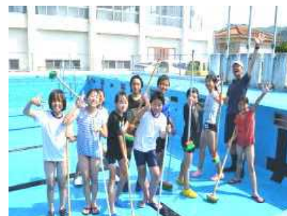
しっかり働く有年っ子たち