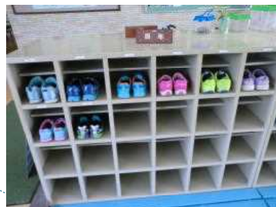
靴がそろうと気持ちがいいね