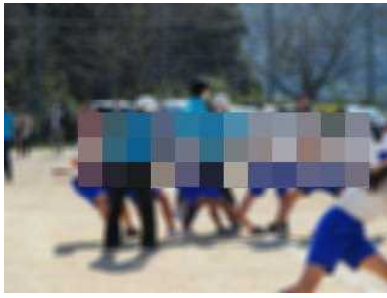
全集中で引きまくれ！