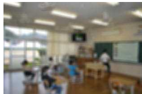
2年 生活科「生き物仲良し大作戦」