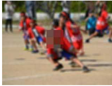
ソーラン節～23人のスマイル～