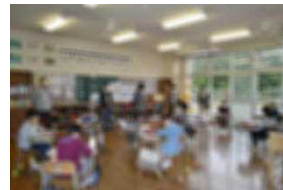
3年 国語科「班で意見をまとめよう」