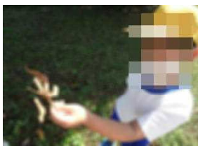
1・2年秋みつけ(10/12沖田遺跡)