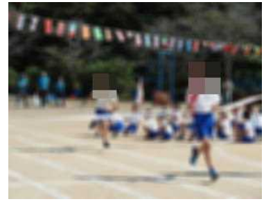
めかれたらめきかえす全校リレー！