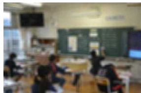
6年 算数科「図形の拡大と縮小」