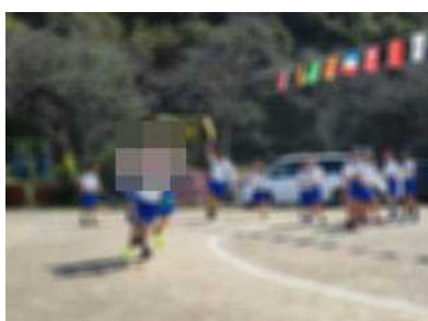
有年っ子きょうだい兜！に駆ける