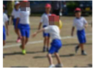
思いをキャッチ！ドッジボール