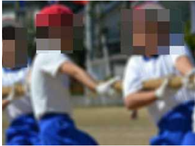
引かれたら引きかえす綱引きだ！