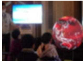
3年環境体験館見学(10/16)