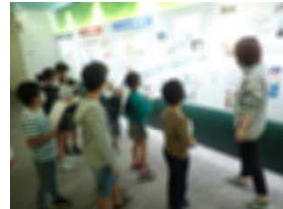
4年アース製薬工場見学(10/14)

※教育活動はすべて感染症予防に配慮して行っていますが、ご心配なことがありましたら、学校にお問い合わせください。