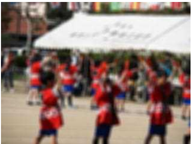
有年っ子音頭は続くよどこまでも