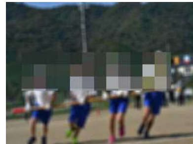
台風有年号もうダッシュ！