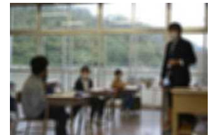
4年 道徳科「夢はかなえるもの」