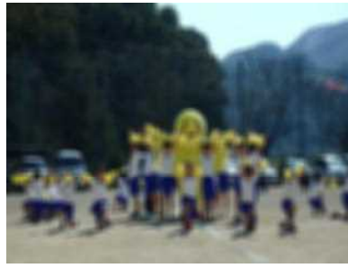
有年からはばだけ！はばタンダンス