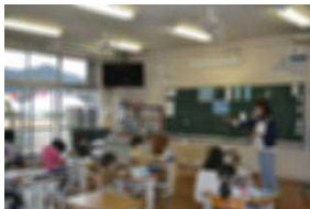
1年 国語科「くじらぐも」

10月23日（金）、十分な感染予防対策のもとで保護者のみの授業参観を行い、教科学習の様子を見ていただきました。本校は、すべての子供に確実な学力を身に付けさせるために、学校規模の良さを生かしたきめ細やかな指導に日々取り組んでいます。