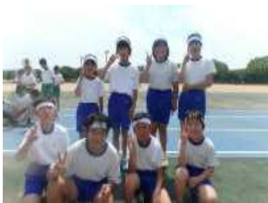
すばらしい走りでした！