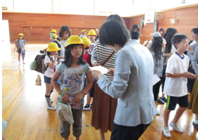
いざという時に備えて

5月19日、参観日のあとに引き渡し訓練を行いました。災害時に冷静・迅速に行動できるよう、真剣に取り組みました。平成16年の水害の教訓を忘れず、これからもしっかりと防災訓練に取り組みます。