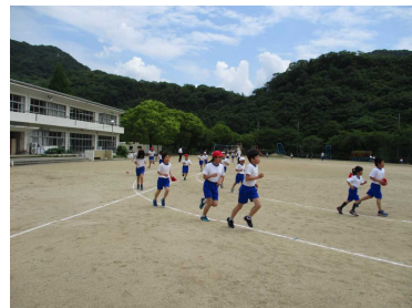
自分を励まして走る

毎年、ゴールデンウィーク（GW）明けから 業間マラソン（GM）を開始し、年間を通じた体カづくりに取り組んでいます。人と比べるのではなく、自分のめあてに向けてコツコツとがんばることを大切にしています。また、地域では「スポーツクラブ21うね」の皆様が生涯スポーツとしてさまざまな計画をされています。ご家族で参加されるのもいいですね。