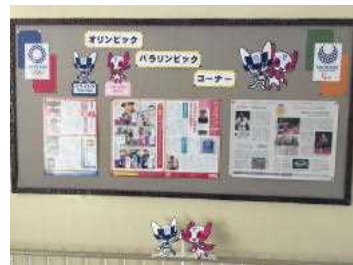
掲示板の「オリ・パラ」コーナー

また、子供たちが東京2020大会を少しでも身近に感じてくれたらと、掲示板にオリンピック・パラリンピックコーナー（オリ・パラコーナー）を設けました。大会マスコットのミライトワ・ソメイティとともに、大会に向けて子供たちが楽しみにしてくれたいと願っています。