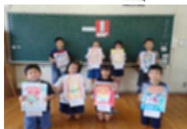
疫病退散を願って

このほど、その予言通りに4年生がアマビエの絵を描き写しました。「早くコロナがおさまりますように」、「有年っ子みんなが病気になりませんように」など、子供たちの気持ちのこもった絵です。