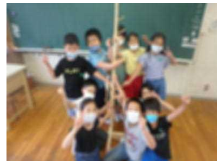
素敵なヒノキの帽子掛け