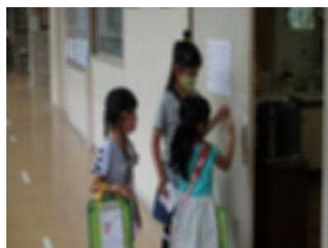
ここは保健室だよ

6月29日（月）～7月3日（金）、1年生が2年生にリードされながら校内を探検しました。